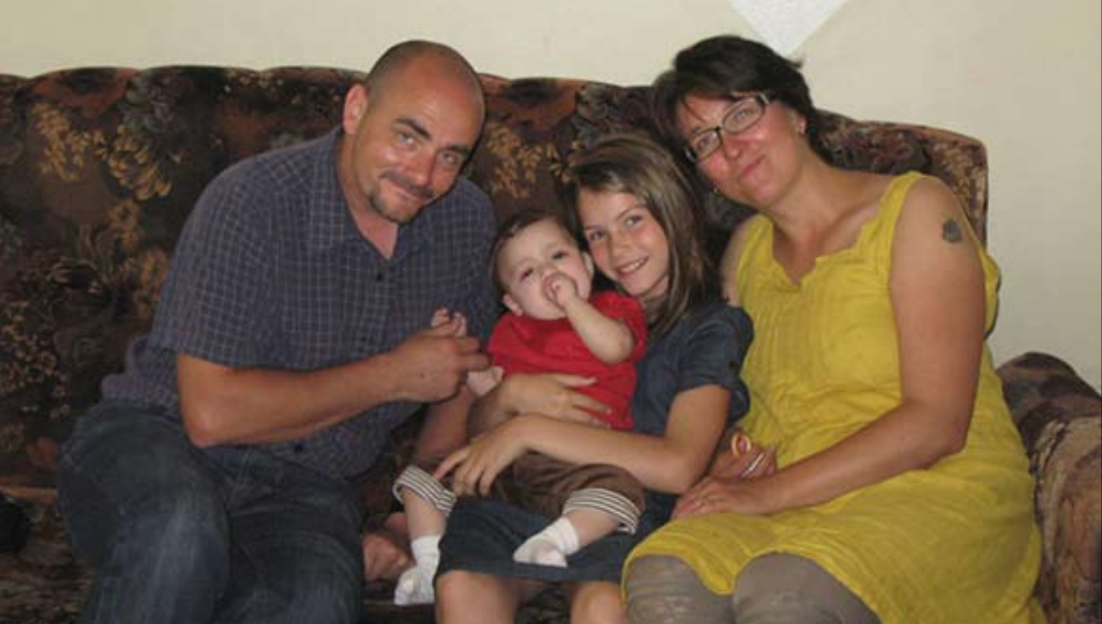
Första mötet med vår blivande son och lillebror.