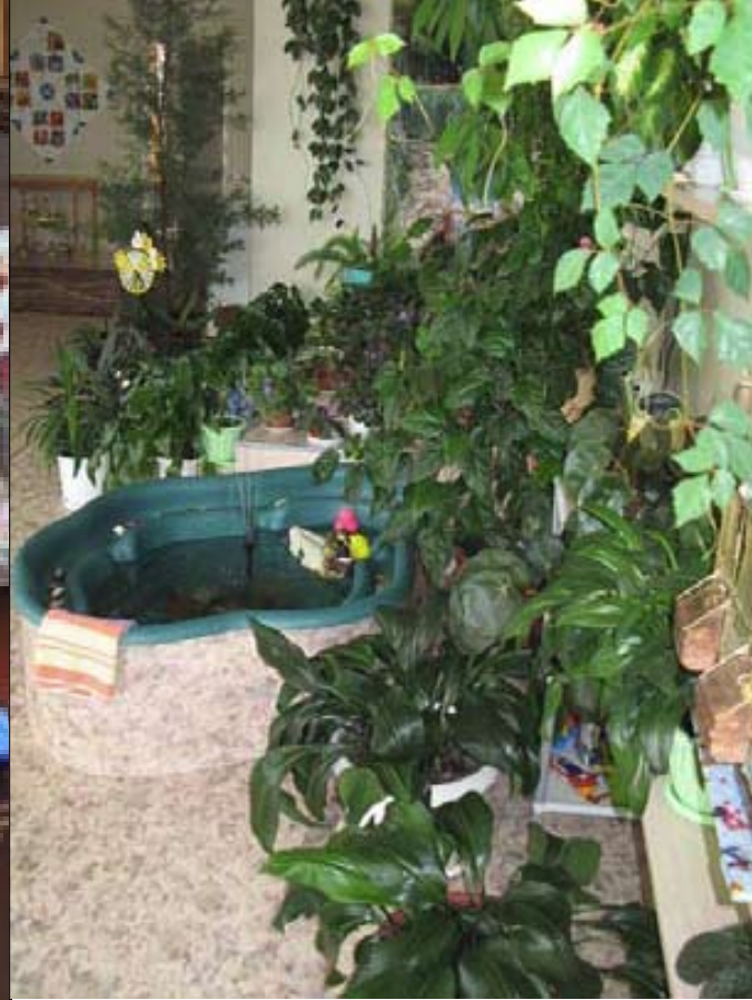
Barnhemmet i Kotlas.

fungerar. Fast för Molly var det nog lite av en chock att komma dit, även om jag tror att hon kommer att bära med sig minnet av resan och Kotlas resten av livet. På rummet fanns bara en säng där vi fick sova alla tre; men desto fler myggor. Det kryllade av dem, trots myggnät runt föntren, och till och med jag som sällan blir myggbiten var alldeles rödprickig i flera dagar efteråt. Fast de kliade inte. Kotlas är ingen supertrevlig plats för turister, vi höll oss inne en hel del, men vi var ju också där för den stora händelsen: barnhemmet.