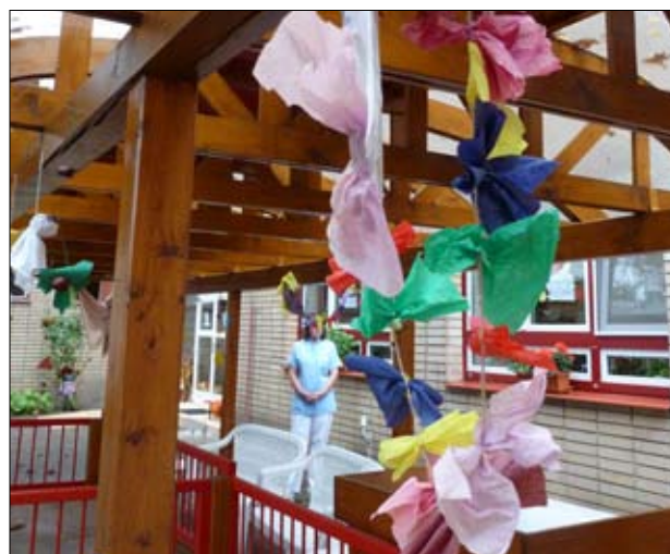
Barnhemmet i Kyjov.

Vi besökte barnhemmet i Kyjov tillsammans med psykologerna på myndigheten. Vägen till Kyjov var väldigt vacker. Barnhemmet låg i anslutning till ett sjukhus och på barnhemmet fanns det 30 platser för barn mellan 0-3 år. De utförde både inhemska och internationella adoptioner. De hade också en dagverksamhet samt en lägenhet där biologiska mammor kunde bo tillsammans med sitt barn under kortare tid för att få stöttning. Vårt intryck var att barnhemmet var välskött och hade en mycket engagerad personal som försökte ta hand om barnen på bästa sätt.