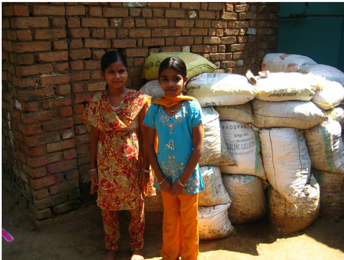
Två bästisar i Raigad.

Normalt avslutas fadderstödet när barnen är 18 år och slutar gymnasiet eller om de börjar arbeta innan och slutar skolan. Det har visat sig att det finns ett intresse, såväl lokalt som bland faddrarna att fortsätta stödja de barn som vill läsa vidare på högre nivåer. BFA-fadder har därför även en fadderverksamhet för universitetsstuderande i Kongo. Under de senaste två åren har antalet akademiska fadderstudenter vuxit till 16 st.