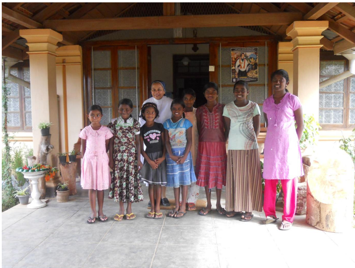
Barn på Good Shepherd Convent på Sri Lanka.

En stor del av fadderbarnen bor i sina familjer men på grund av fattigdom kan föräldrarna inte bekosta barnens skolgång. De, drygt 160 barn, som vi t ex bistår genom samarbetet med CASP (Community Aid Sponsorship Programme) i Indien bor tillsammans med sina föräldrar liksom barnen i bl a Nepal, Kongo, Burundi och Vietnam.