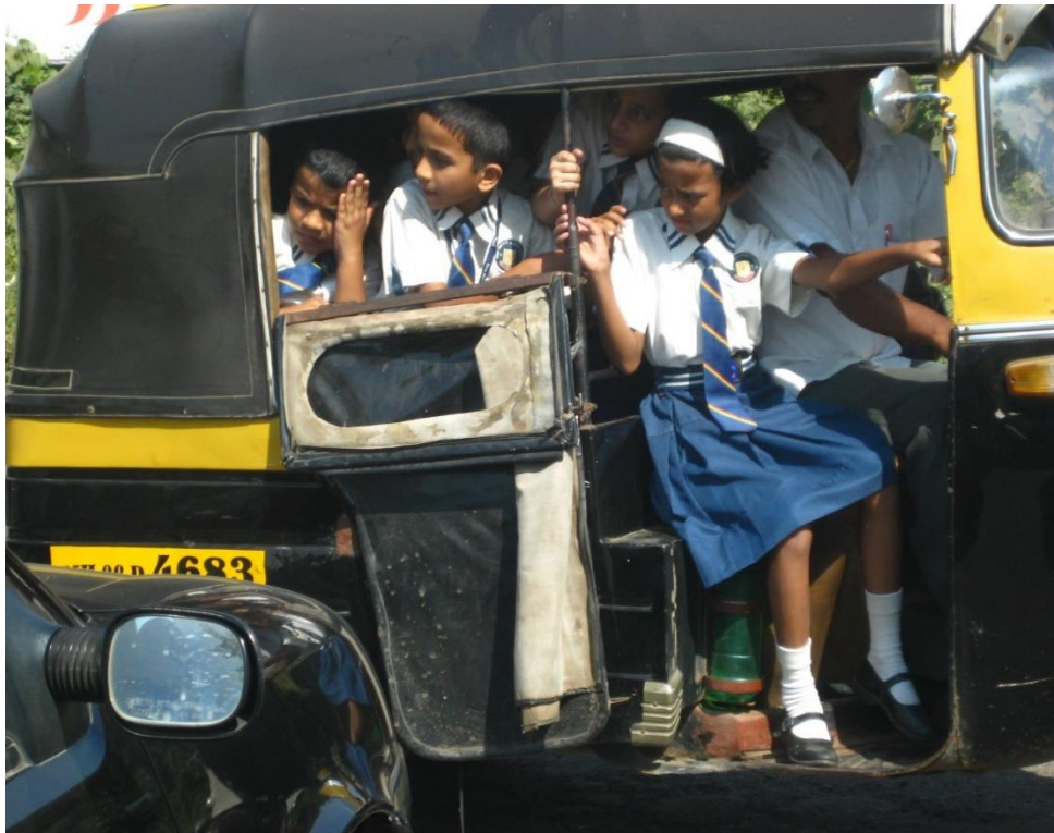
På väg till skolan, Mumbai, Indien.

Föräldrarna till dessa barn är mycket fattiga. Oftast är det en ensamstående mamma med flera barn som saknar ekonomisk möjlighet att bekosta skolgången och därför har lämnat ett eller flera av sina barn att bo där under terminerna för att kunna få regelbunden skolgång och omvårdnad.