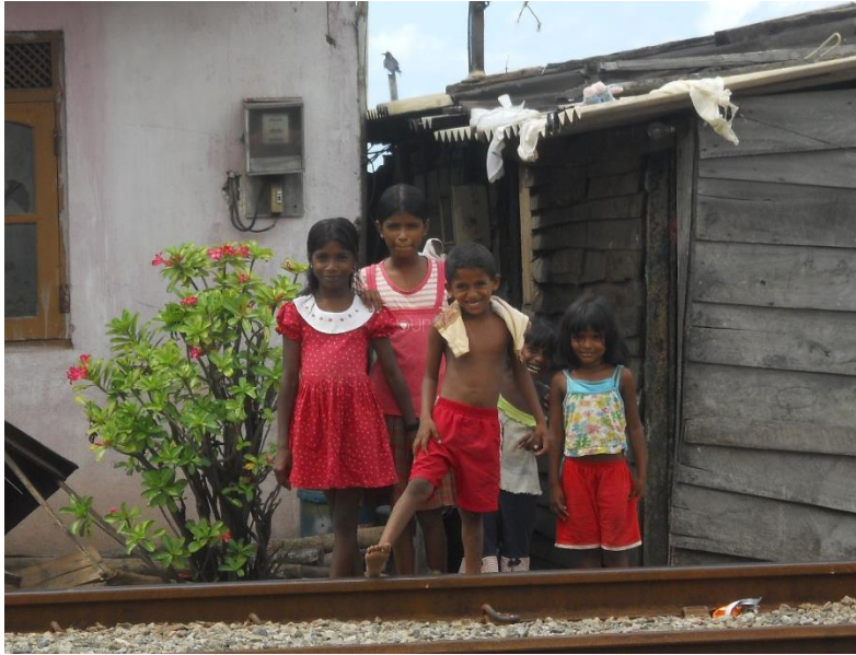
Glada och nyfikna barn på Sri Lanka

Normalt avslutas fadderstödet när barnen är 18 år och slutar gymnasiet eller om de börjar arbeta innan och slutar skolan. Det har visat sig att det finns ett intresse, såväl lokalt som bland faddrarna att fortsätta stödja de barn som vill läsa vidare på högre nivåer. BFA-fadder har därför även en fadderverksamhet för universitetsstuderande i Kongo. Under de senaste två åren har antalet akademiska fadderstudenter ökat.