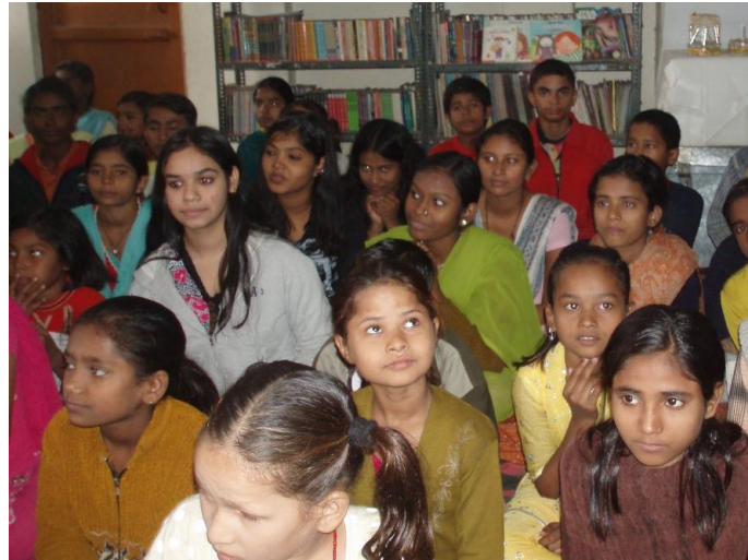
Besök i en skolklass i Delhi./Foto : Erna Lagerfors

Föräldrarna till dessa barn är mycket fattiga. Oftast är det en ensamstående mamma med flera barn som saknar ekonomisk möjlighet att bekosta skolgången och därför har lämnat ett eller flera av sina barn att bo där under terminerna för att kunna få regelbunden skolgång och omvårdnad.