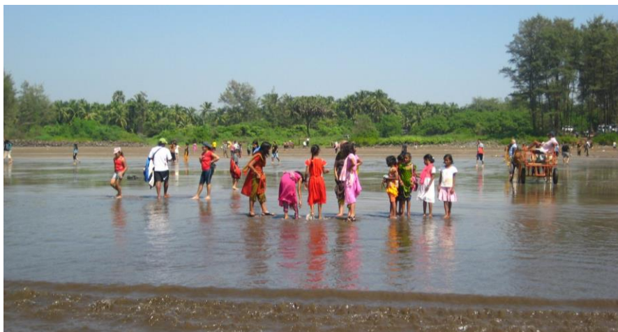
Friluftsdag i Raigad/. Foto: Erna Lagerfors

En stor del av fadderbarnen bor i sina familjer men på grund av fattigdom kan föräldrarna inte bekosta barnens skolgång. De, drygt 116 barn, som vi t ex bistår genom samarbetet med CASP (Community Aid Sponsorship Programme) i Indien bor med sina föräldrar liksom barnen i bl a Nepal, Kongo, Burundi och Vietnam.