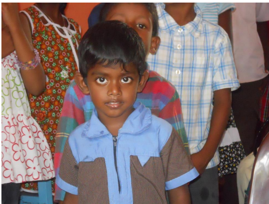
På besök hos fadderbarn på Sri Lanka

Genom fadderbidraget ger man barnet möjlighet till skolgång som är en möjlighet för fadderbarnet att få ett bra liv.