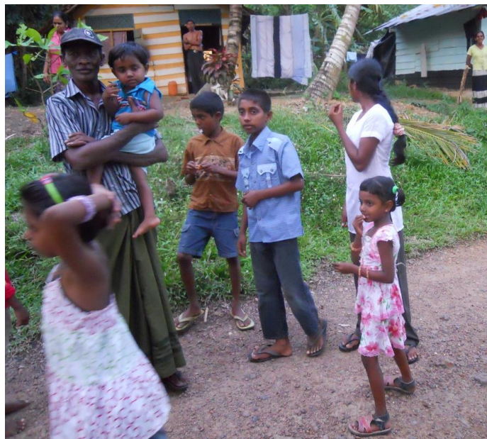
Besök i en by på Sri Lanka/.

De allra flesta studenterna får dubbelt eller tredubbelt fadderbidrag. Detta räcker normalt inte till för att täcka kostnaderna för akademiska studier men utan dessa bidrag skulle studenterna få mycket svårt att klara sig. BFA har därför även bildat en fond, University Fund, där studenter kan ansöka om större bidrag till sina studier. Studierna följs upp genom regelbundna rapporter varje termin.