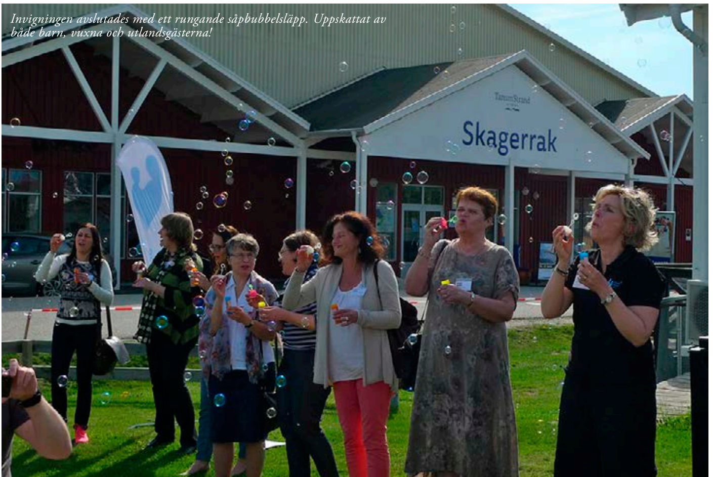
Inviaktionen avslutades med ett rungande såpbubblsläpp. Uppskattat av både barn, vuxna och utlandsgästerna!

Hör av dig till medlemsgruppen@bfa.se om du skulle vilja hjälpa till med sommarträffen eller har några andra, kreativa idéer!