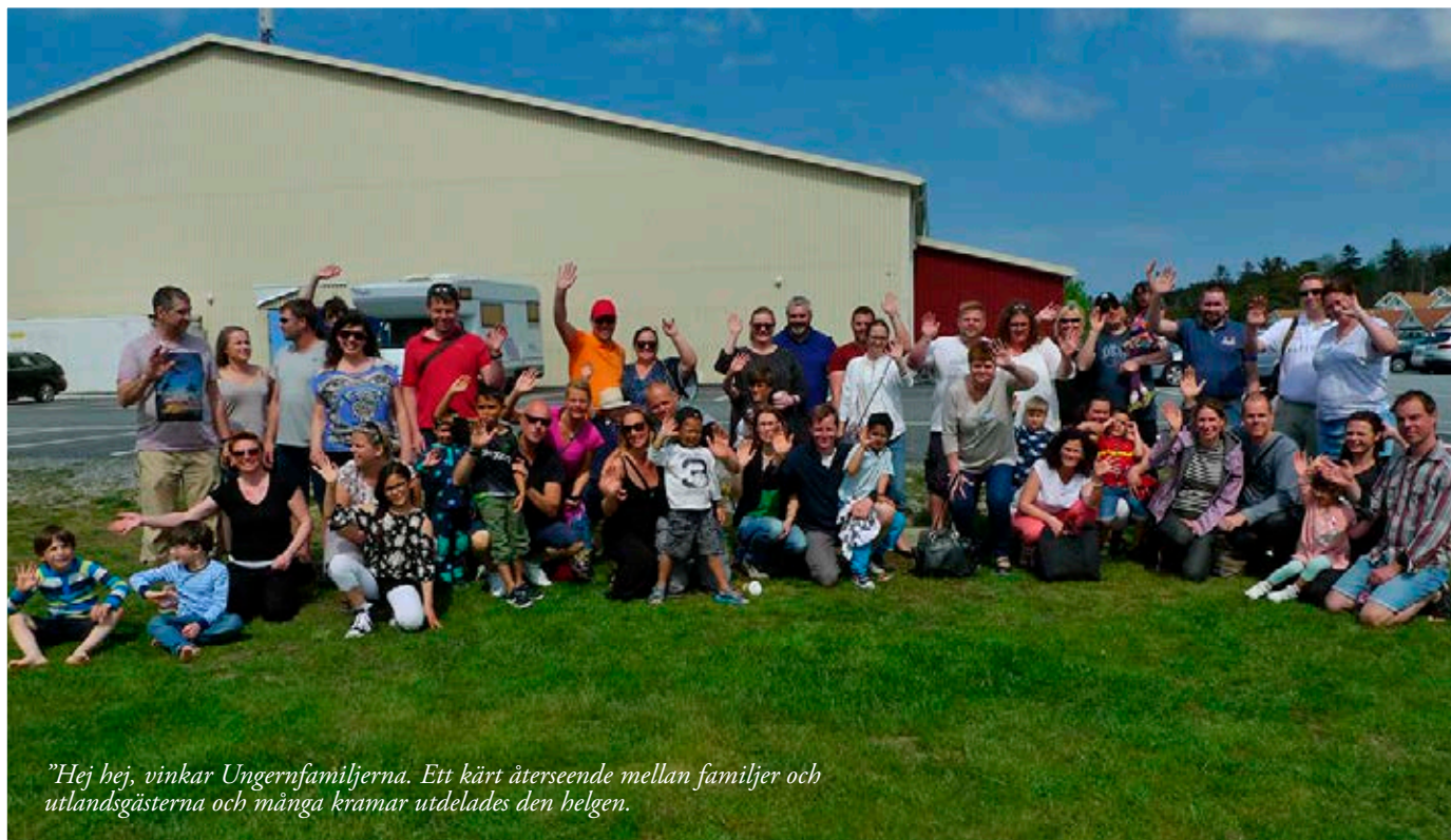
"Hej hej, vinkar Ungernfamiljerna. Ett kärt återseende mellan familjer och utlandsgästerna och många kramar utdelades den helgen."