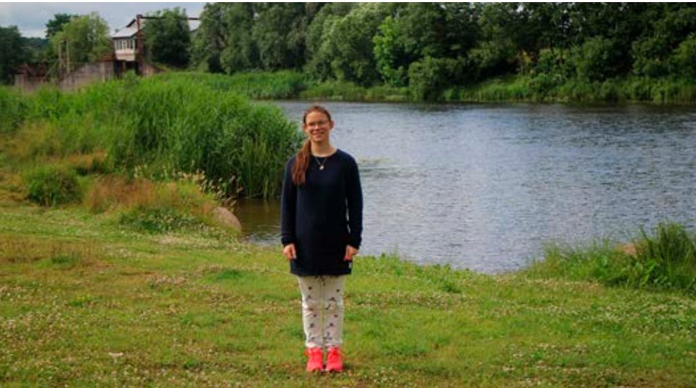
Vid hotellet Bangas sjö.

Jag och min bästa vän Felicia skulle prova att gå en runda som mamma rekommenderade oss men tror det eller ej, vi gick vilse. Vi gick så långt så att vi