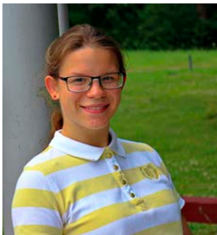
Profilbild av mig.