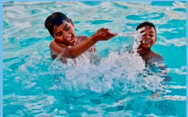
Poolen på Best Westerns hotellanläggning var populär bland ungdomarna.