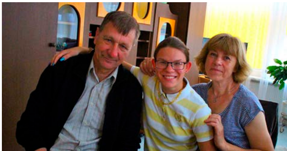
Jag med min gamla fröken på barnhemmet och hennes man som var vaktmästare på barnhemmet.

JAG ÄR EN GLAD 17-ÅRIG TJEJ som föddes i Litauen i staden Tauragė 1999. Jag flyttades sedan till spädbarnshemmet i Klaipėda och vid tre till fyra-års åldern flyttade jag till barnhemmet i Tauragė.