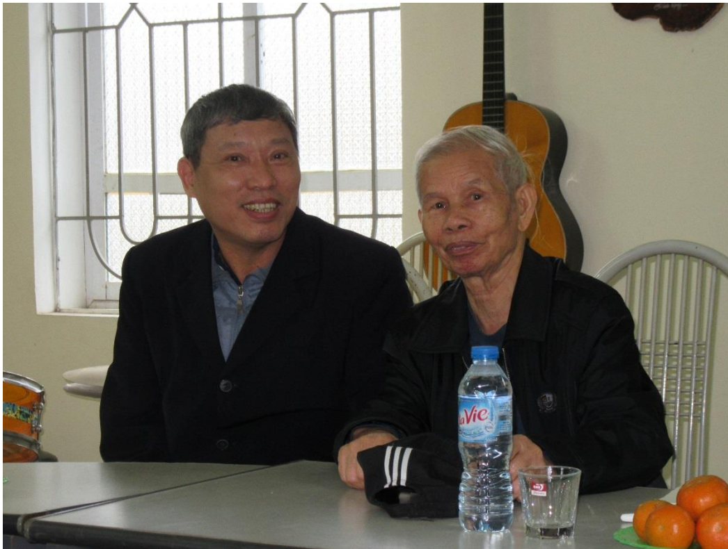
Mr. Bao och Mr. Thuong (tolk)

I fadderbarnsprogrammet finns 72 barn inskrivna. Av dessa sponsrar FFBB 43 barn och BFA 29. 10 barn står på väntelista för att få faddrar.