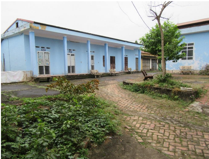
Huslängan med kontor och möteslokal

Väggar behöver målas, gardiner sätts upp och leksaker och redskap för träning införskaffas. För att kunna göra förbättringar behövs beslut av Folkkommittén. En eventuell flytt av verksamheten beslutas också av Folkkommittén.