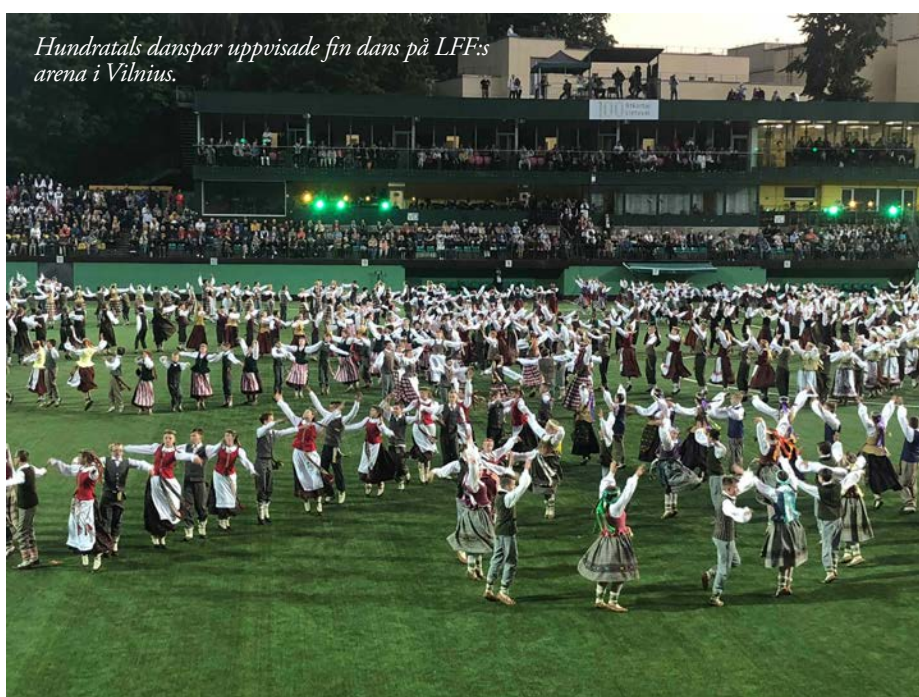
Hundratals danspar uppvisade fin dans på LFF:s arena i Vilnius.

Jag och mamma vaknade ganska sent och höll på att missa frukosten. Efter en snabb och enkel frukost, shoppade vi loss i en affär som heter New Yorker. De hade mycket fint som jag tyckte om för väldigt bra pris.