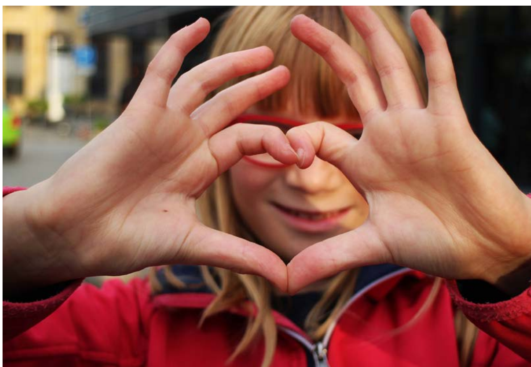
Simutes kärlek till Litauen.

Idag har vi ätit sista frukosten på hotellet och packat ner alla kläder och saker som knappt fick plats. Vi checkade ut och åkte till flygplatsen med taxin som väntade på oss. Allt gick smidigt och enkelt på flygplatsen. På förmiddagen svensk tid landade vi äntligen hemma i Sverige.