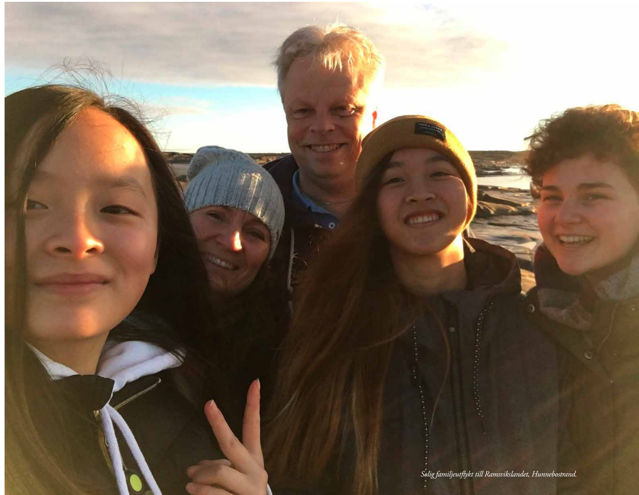
Solig familjeutflykt till Ramsviklandet, Hunnebostrand.

Fyllda med längtan efter nästa träff. Berikade med nya familjemedlemmar – allt tack vare en kvinna på andra sidan jorden. Kanske får även hon en vacker dag se sina döttrar tillsammans.