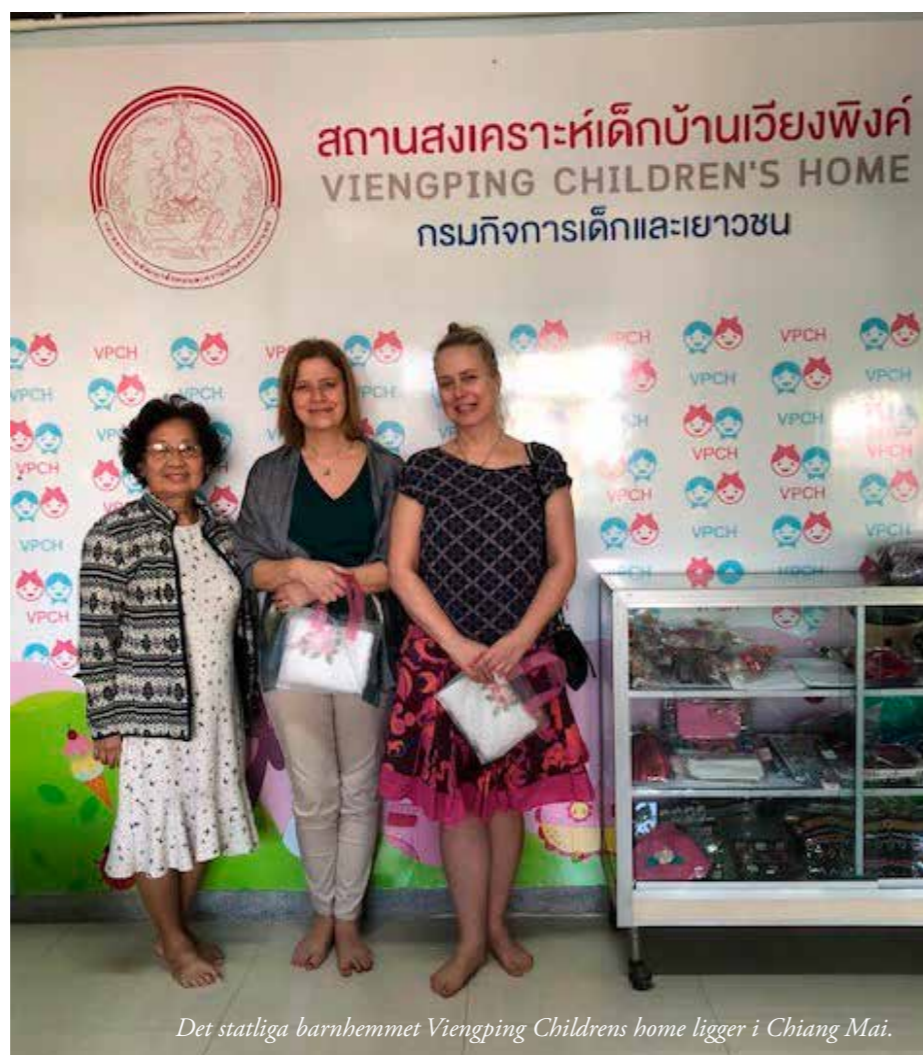
Det statliga barnhemmet Viengping Childrens home ligger i Chiang Mai.

i fosterfamilj. Vi hade möjligheten att besöka en amerikansk fosterfamilj och fick där se hur positivt det kan vara för ett barn att få den extra uppmärksamhet och trygghet som en familj kan ge. Vårt intryck av de bägge statliga barnhemmen är att de arbetar professionellt, barnhemmen är av god standard och de försöker, trots knappa resurser, ge barnen en god omvårdnad.