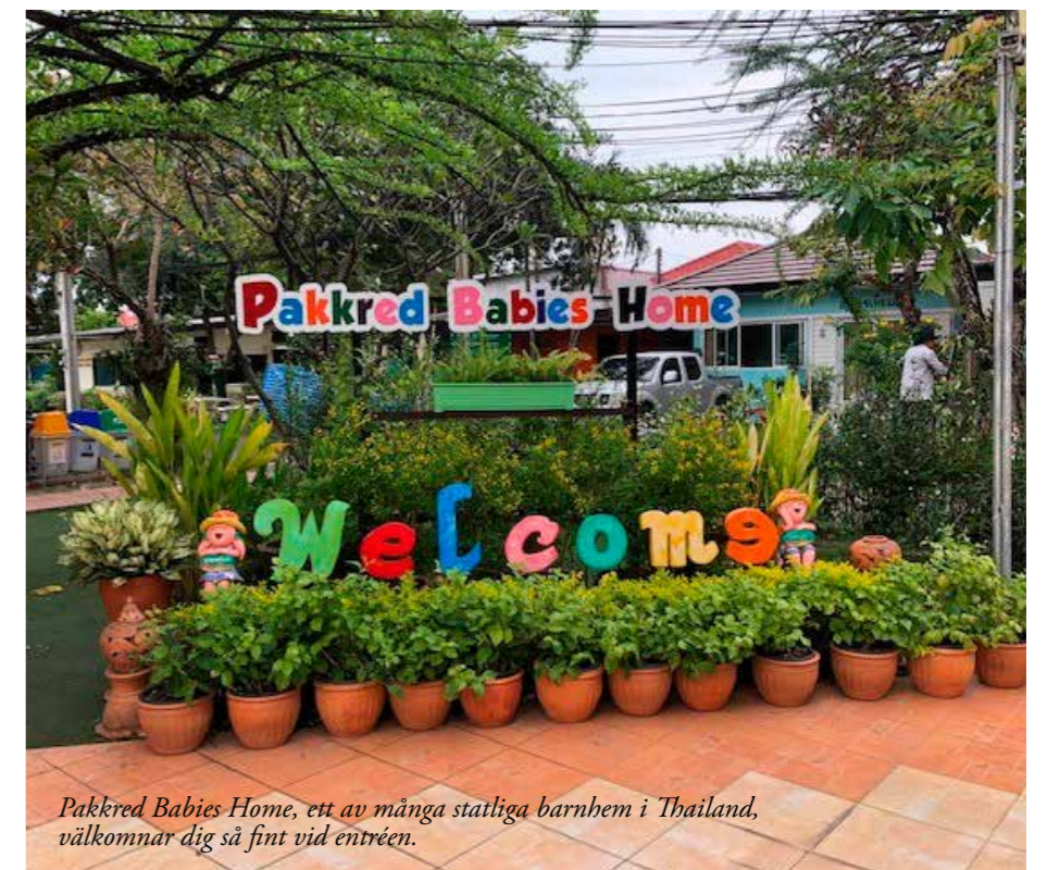
Pakkred Babies Home, ett av många statliga barnhem i Thailand, välkomnar dig så fint vid entrén.

Det är alltid intressant och givande att besöka de länder vi är verksamma i. BFA började med att besöka Child Adoption Center(CAA), som är den avdelning på DCY som handlägger internationella adoptioner, och fick där möjlighet att diskutera aktuella samarbetsfrågor. De berättade att CAA återigen kommer att bjuda in till Nativeland Visit i juli 2019. Detta är ett mycket uppskattat program då de bjuder in familjer som adopterat barn från Thailand på ett återreseprogram. Vår handläggare på DCY tog med oss till ett av de statliga barnhemmen i Bangkokområdet, Pakkred Babies' home. BFA har förmedlat ett flertal barn från detta barnhem genom åren. Idag har de närmare 300 barn på barnhemmet och det är ca 60 nannies och ett flertal volontärer