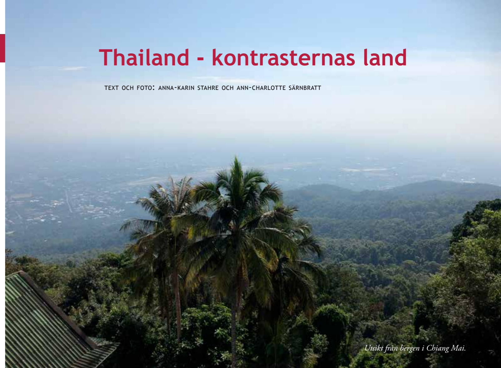
Utsikt från bergen i Chiang Mai.

TEXT OCH FOTO: ANNA-KARIN STAHERE OCH ANN-CHARLOTTE SÄRNBRATT