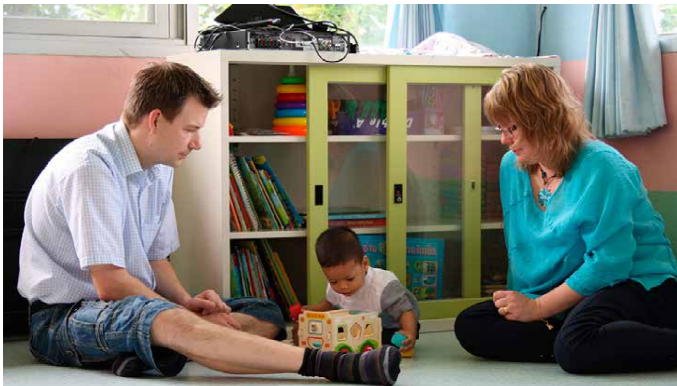
Vi leker tillsammans vid allra första mötet.