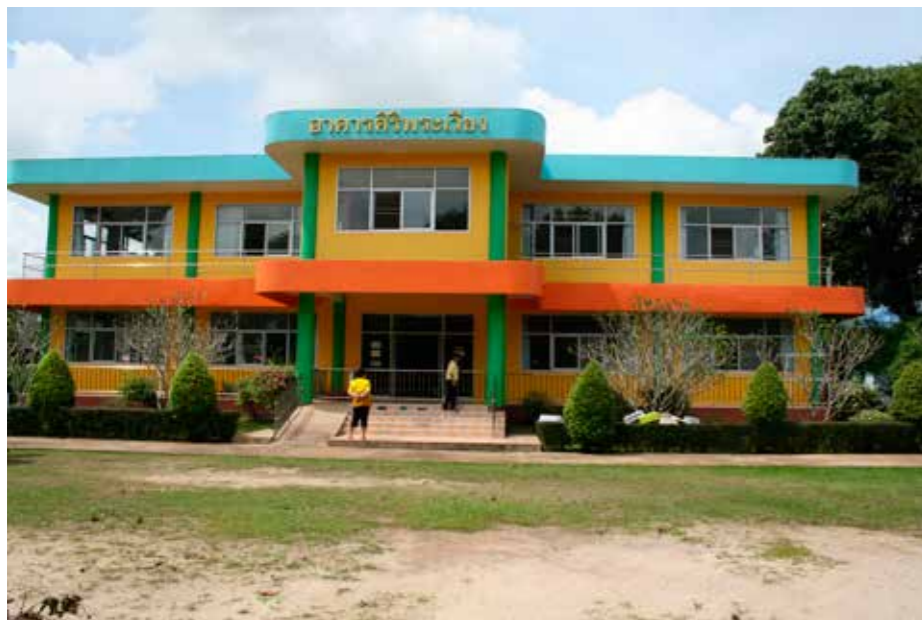
Framsidan av barnhemmets småbarnsavdelningar/hus.

Vi kom till Bangkok tidigt på morgonen lokal tid på lördagen och tog oss till hotellet där vi skulle bo under tiden i Bangkok. Där packade vi upp och vilade och sen rekognoserade vi i närområdet för att ha lite koll på vart man kunde gå och äta, handla och så vidare när vi sen skulle bo där med lilleman. Dagen efter packade vi ner det vi kunde behöva för dagarna i Nakhon och flög dit. Det var viktbe-gränsning på inrikesplanet vilket vi inte hade haft styr på om vi inte hört det av tidigare resenärer, därför valde vi att ha