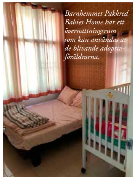
Barnhemmet Pakkred Babies Home har ett övernattningsrum som kan användas av de blivande adoptivföräldrarna.

tar hand om dem. Barnhemmet har ett övernattningsrum där familjer kan sova över när de hämtar sina barn, vilket kan vara en fördel, då man slipper sitta i långa bilköer och på så sätt får mer tid att tillbringa med barnet.