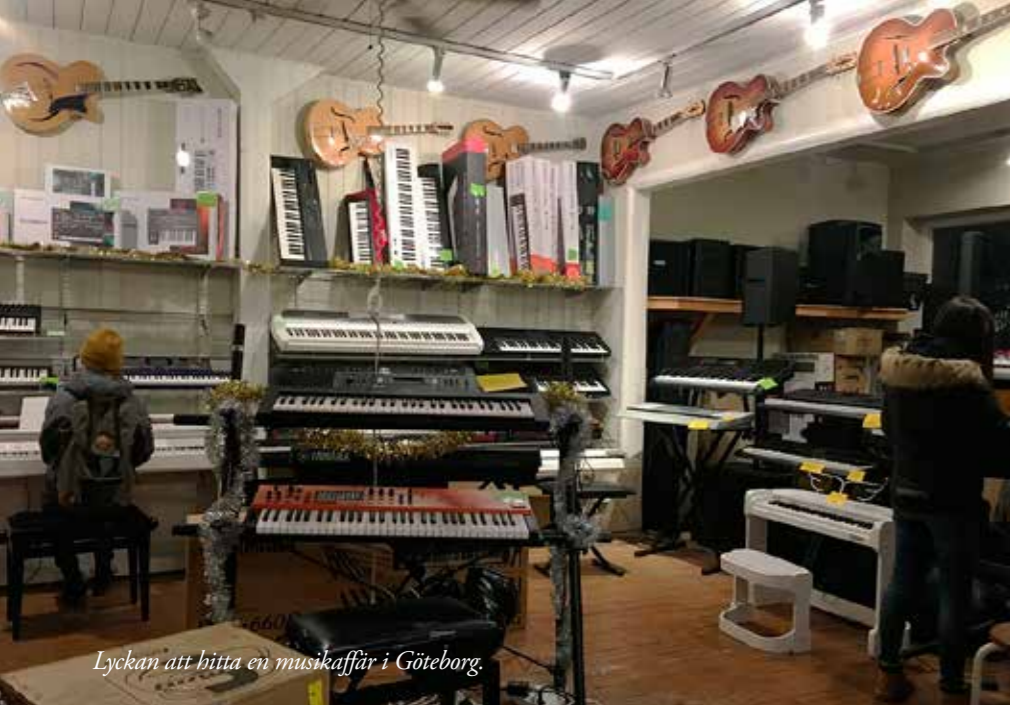
Lyckan att hitta en musikaffär i Göteborg.