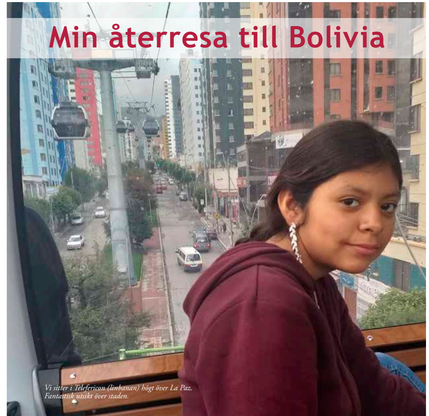
Vi sitter i Telefericon (linbanan) högt över La Paz. Fantastisk utsikt över staden.