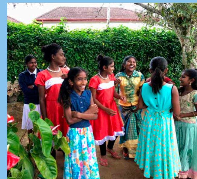
Flickorna i trädgården.

Det är en skön februarieftermiddag i Bandarawela. Vädret påminner om en svensk solig försommardag. Bandarawela ligger i bergen i södra Sri Lanka och här är svalt, på gränsen till kallt nattetid, och ganska