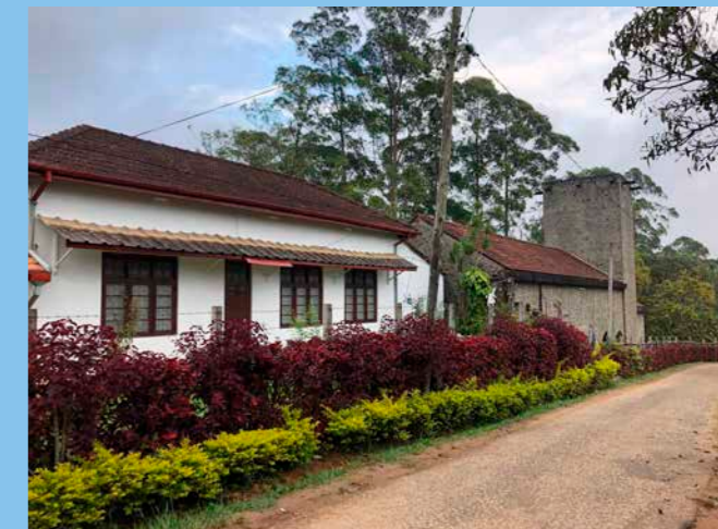
Good Shepherd's Convent.

Många av barnen som bor på klostrets skolhem är döttrar till dessa teplockande kvinnor eller kommer från andra fattiga familjer i området. De kan ha lång väg till skolan och ingen praktisk eller finansiell möjlighet att ta sig till skolan varje dag. De kan också vara barn till ensamstående föräldrar och/eller till föräldrar som arbetar utomlands. I vissa fall har barnen inga föräldrar alls, utan det är släkten som tar hand om dem. Barnen bor på skolhemmet under skolåret, men reser hem till familj/släkt under loven. Det är bara flickor som bor här, just nu 20 flickor i åldrarna 9-19 år. Man har dock plats för 25 flickor, så det finns utrymme att ta emot några till.