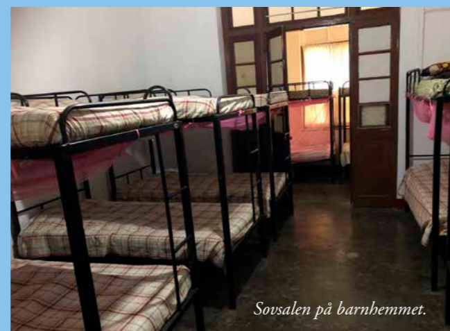
Sovsalen på barnhemmet.

Vi får sedan en rundvandring i lokalerna och trädgården. Vi får se sovsalen, där de alla har varsin sängplats bland våningssängarna som står uppradade. De har också ett eget skåp med sina personliga tillhörigheter och kläder. Det är rent och fräscht, men mycket enkelt. Vi får även se köket, matsalen och ett litet rum som de ber sin morgonbön i. Vi frågar