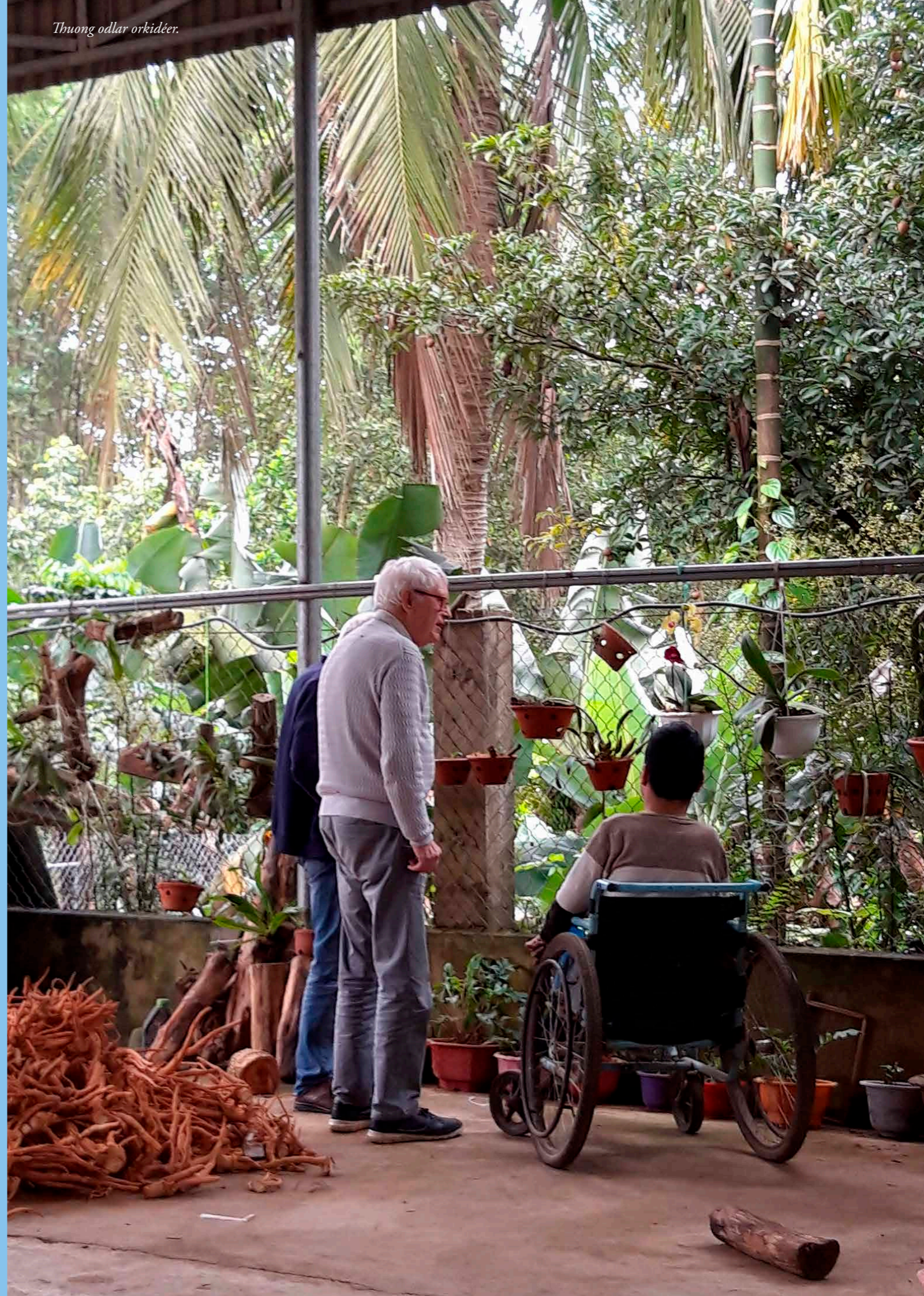
Thuong odlar orkidéer.