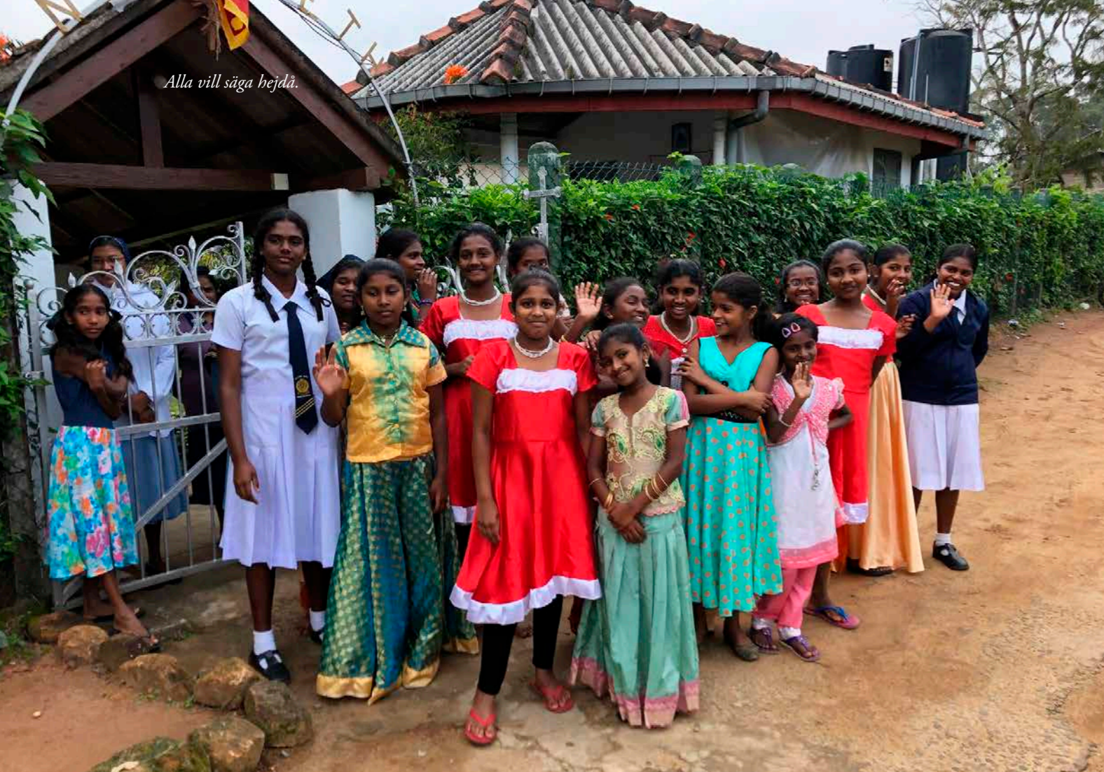
Alla vill säga hej då.

om alla flickor är katoliker, men får veta att endast åtta barn kommer från katolska familjer och resten är hinduer. På morgonbönen ber man helt enkelt utifrån sin egen trosuppfattning och har respekt för varandras olikheter.