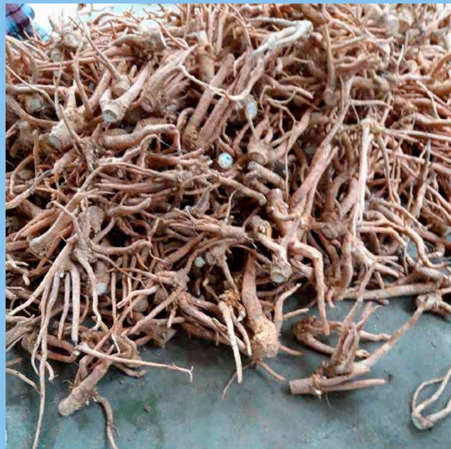
Farmor tjänar en hacka på att processa och sälja en nyttig rot.

Terrassen är både sällskapsrum, arbetsrum och förvaringsrum. Här ligger en stor hög med nyttiga rötter, "ginko biloba" (ungefär Ginseng). De ska torkas och sedan malas och säljas.