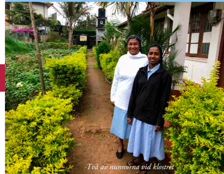
Två av nunnorna vid klostret

Vid min semesterresa med familjen till underbara Sri Lanka tidigare i år, passade vi på att besöka Good Shepherd's Convent i Bandarawela.