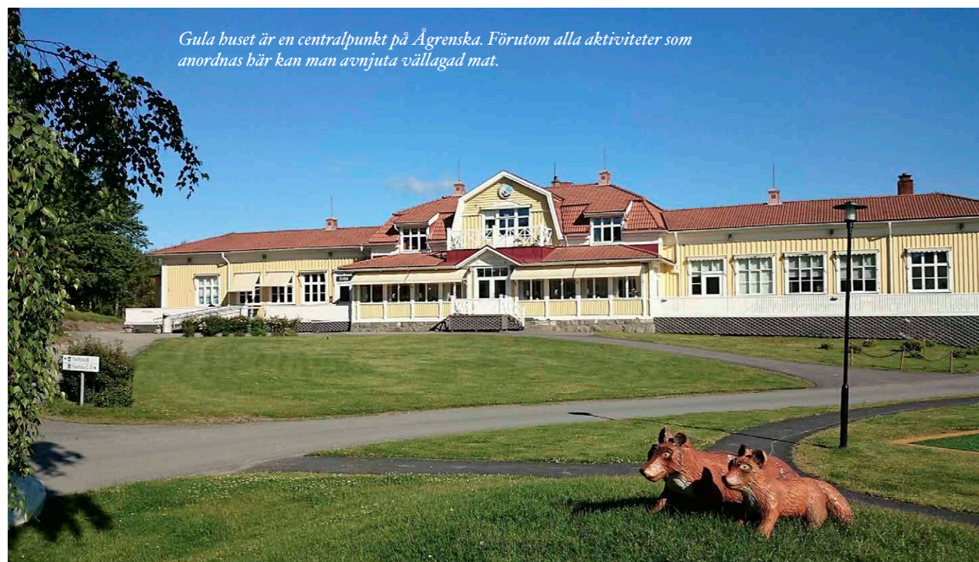
Gula huset är en centralpunkt på Ågrenska. Förutom alla aktiviteter som anordnas här kan man avnjuta vällagad mat.

På Lilla Amundön har barns hälsa varit i fokus i över 100 år. De senaste 30 åren har barn med funktionsnedsättningar varit i fokus. Ågrenska vill öka kunskapen och kompetensen om sällsynta diagnoser och mer vanligt förekommande funktionsnedsättningar för att kunna skapa förutsättningar för ett optimalt liv för alla.