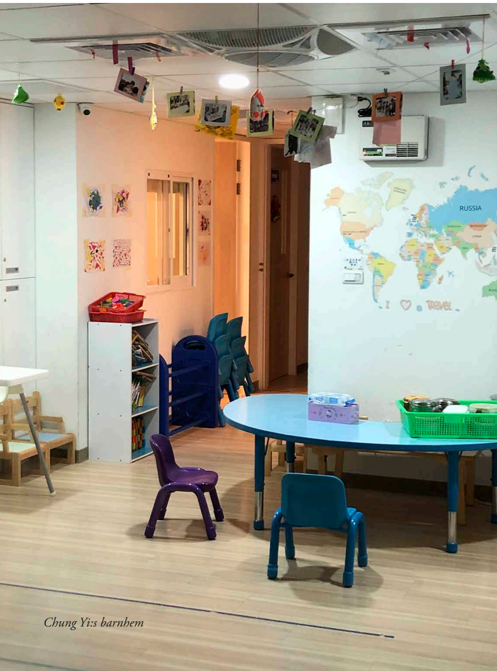
Chung Yi's barnhem

stort värde i att till exempel kunna ta med varje enskilt barn till affären för att köpa nya skor och annat. Tanken är att det på så många sätt som möjligt ska efterlikna ett familjeliv och att barnens behov av omsorg och uppmärksamhet ska tillgodoses.