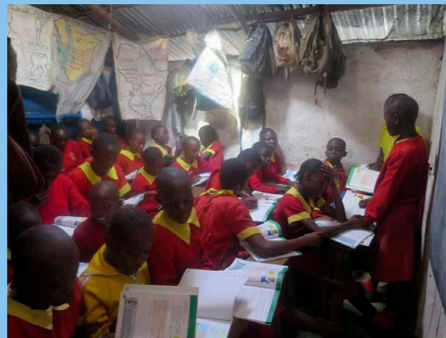
Undervisningen möjliggör en framtid för barnen och motivationen till att lära är stor.

Kom ihåg att ange vart pengarna skall gå till Oloo School.