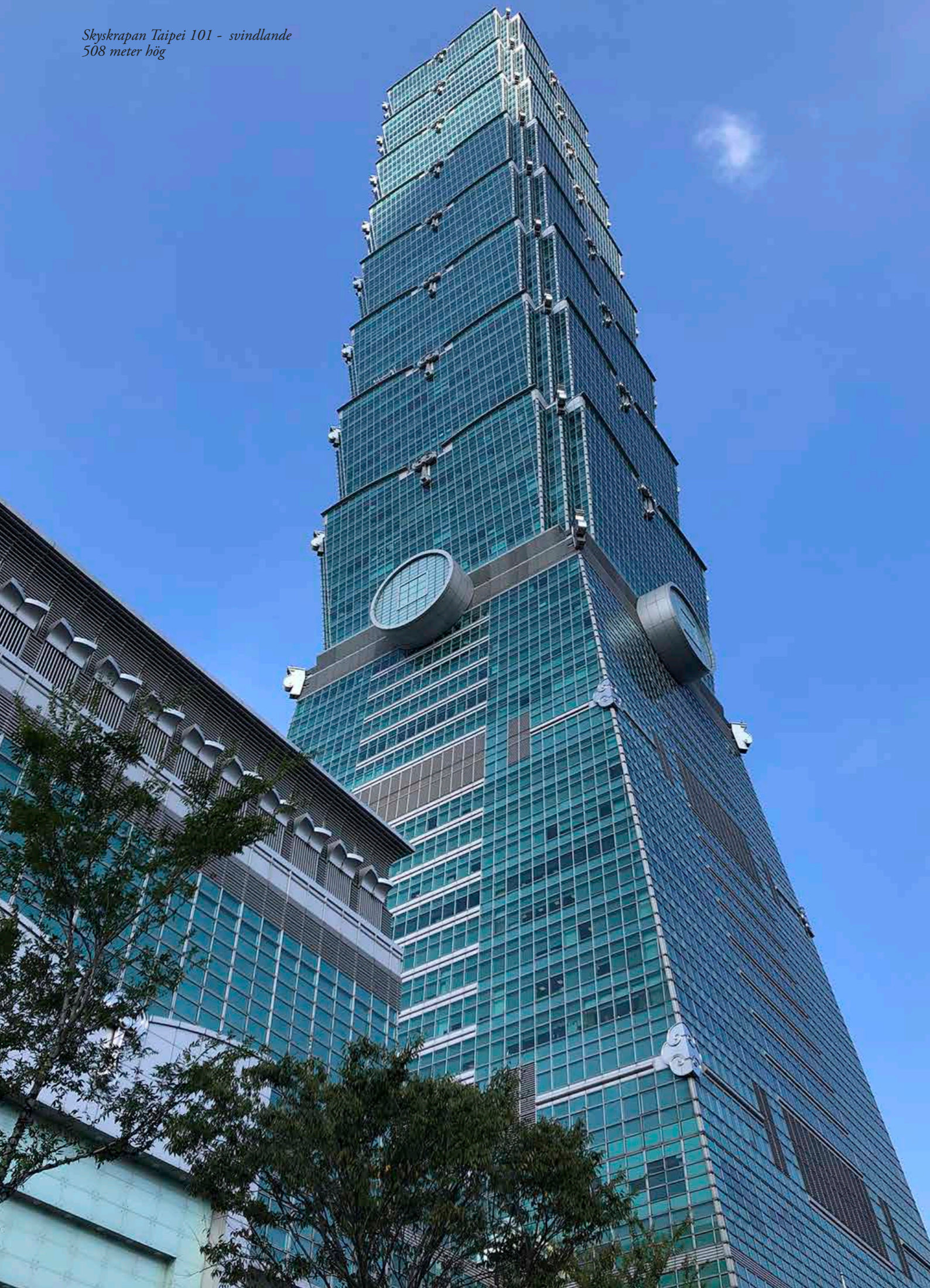
Skyskrapan Taipei 101 - svindlande 508 meter hög

Håkan gav sin bild av hur det politiska läget ser ut i Taiwan, om förhållandet Taiwan-Kina och annat. Som vi förstår det finns det i befolkningen ett stort stöd för att Taiwan ska fortsätta med nuvarande politiska hållning gentemot Kina, alternativt jobba för total självständighet. Endast 10 procent av befolkningen är för en återförening med Kina, och detta gäller främst den äldre generationen.