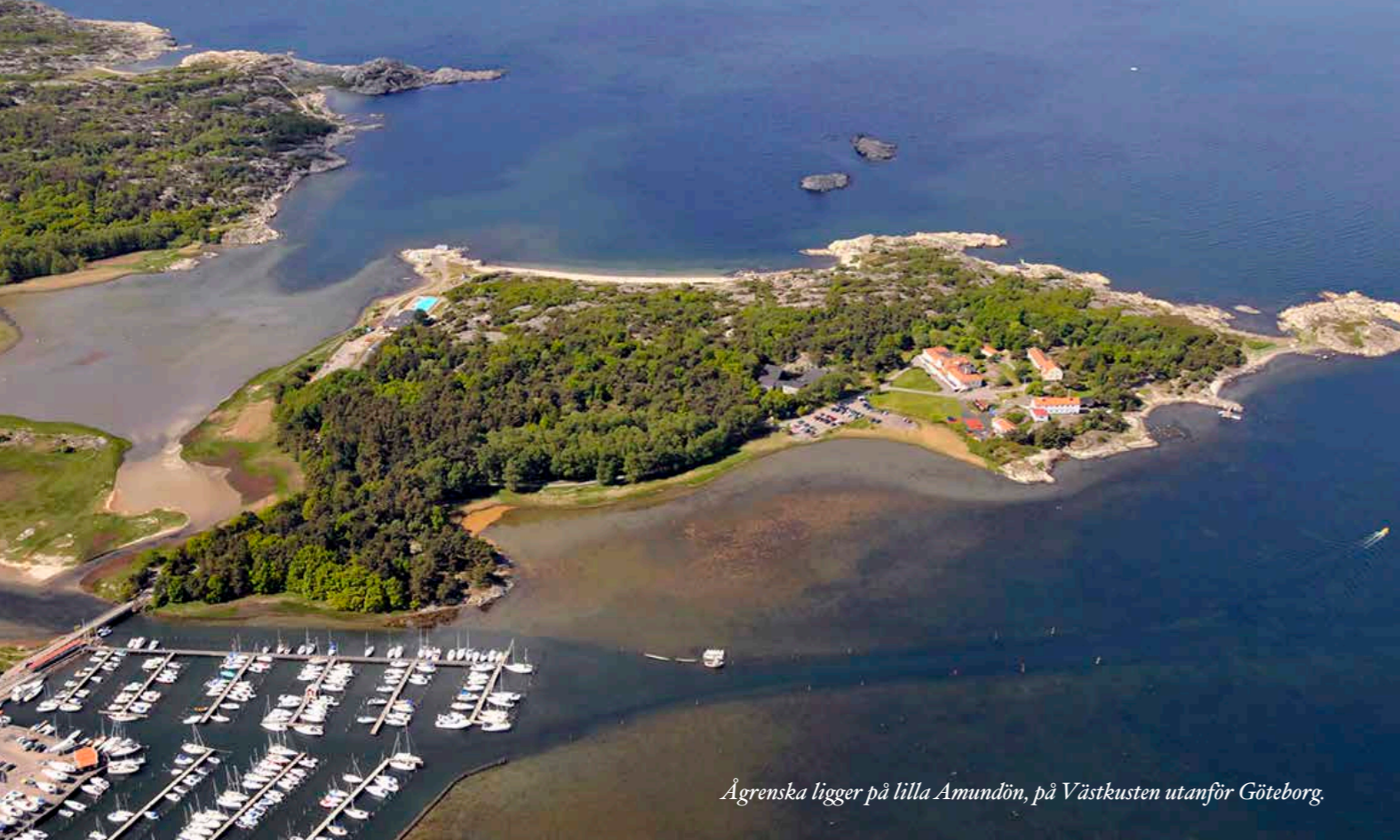
Ågrenska ligger på lilla Amundön, på Västkusten utanför Göteborg.

På Lilla Amundön har barns hälsa varit i fokus i över 100 år. De senaste 30 åren har barn med funktionsnedsättningar varit i fokus. Ågrenska vill öka kunskapen och kompetensen om sällsynta diagnoser och mer vanligt förekommande funktionsnedsättningar för att kunna skapa förutsättningar för ett optimalt liv för alla.