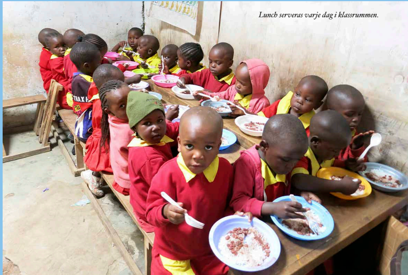
Lunch serveras varje dag i klassrummen.

Föreningen arbetar direkt utan mellanhänder med att samla in pengar till skolan, till barnen och för deras framtid.