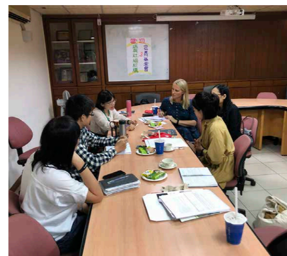
Möte på TFCF i Taichung