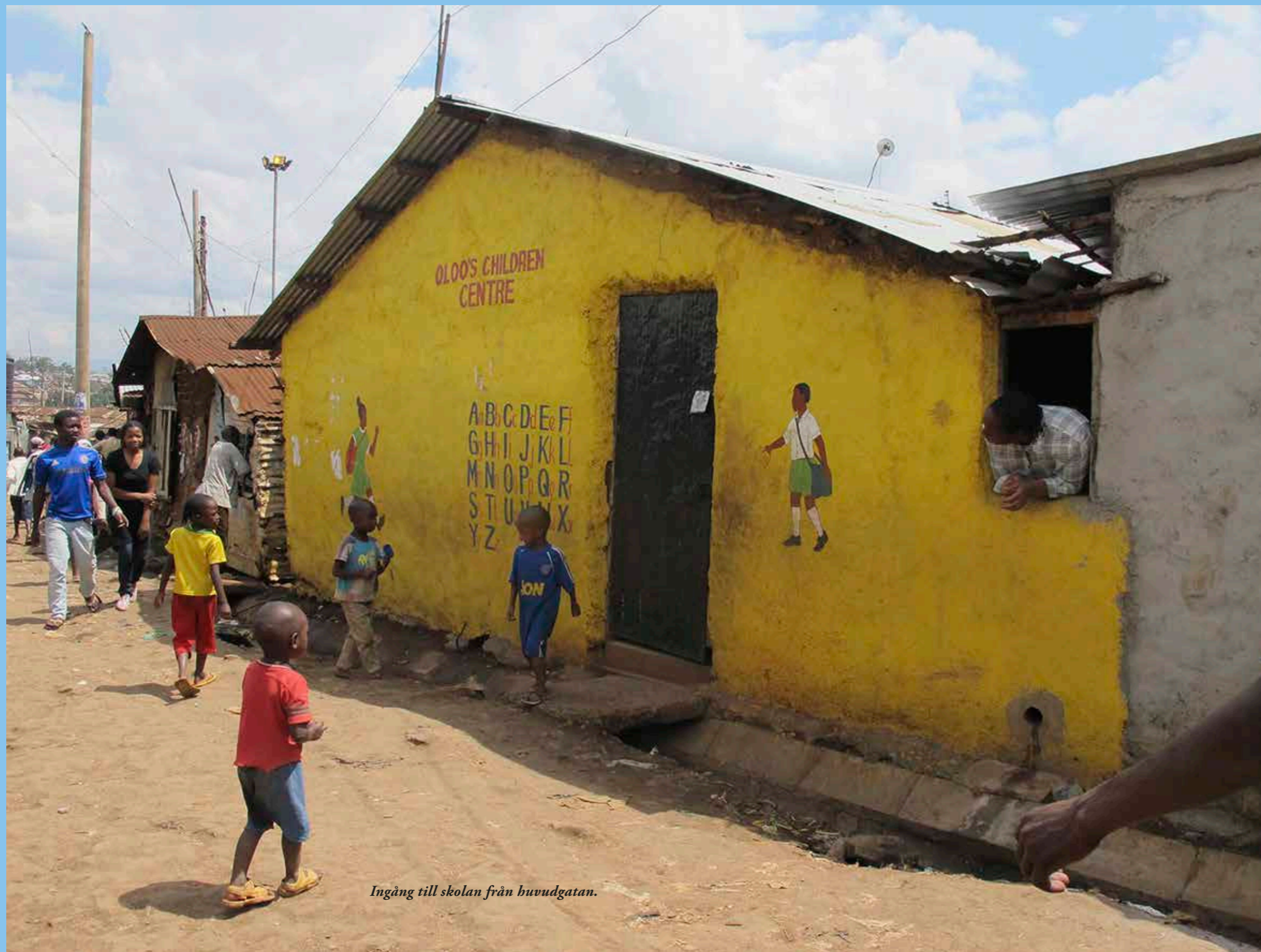
Ingång till skolan från huvudgatan.