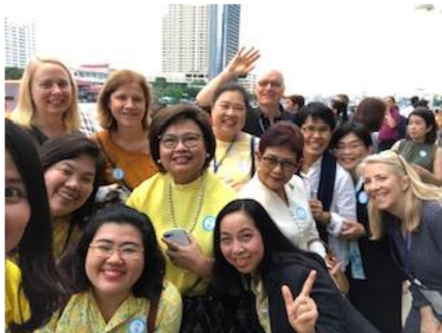
Utflykt med DCY:s personal under Native land visit program

BFA samarbetar i Thailand med den statliga adoptionsmyndigheten Department of Children and Youth (DCY) och med den auktoriserade organisationen Thai Red Cross Children's Home (TRCCH) i Bangkok. Under 2019 kom det hem sex barn till sina familjer i Sverige varav fyra barn från DCY:s barnhem och två barn från TRCCH. Åldern på barnen var vid hemkomst mellan 1 och 3 år.