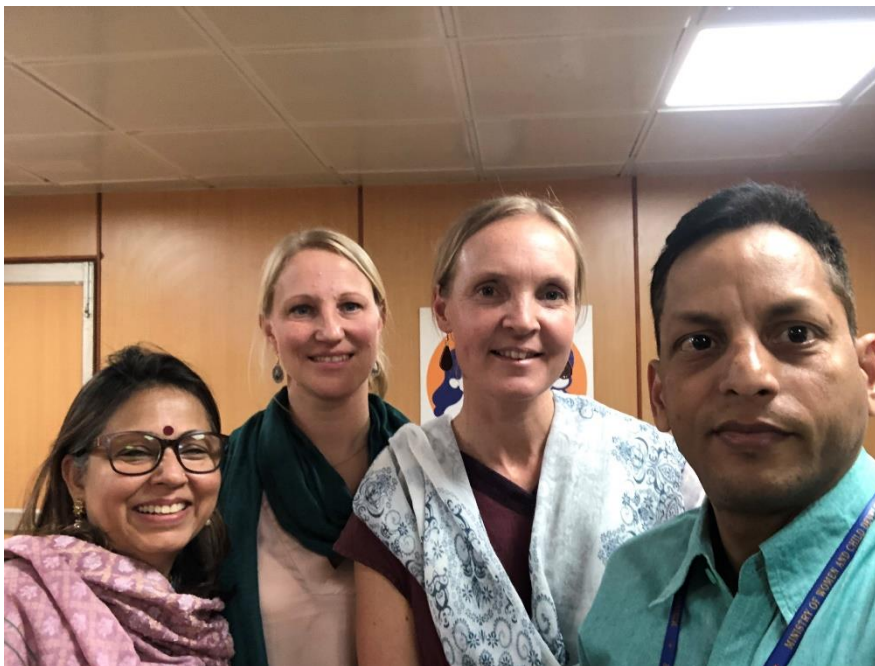
BFA på besök hos CARA

Åtta barn från Indien fick familjer i Sverige under 2019 genom BFA. Barnen som kom till sina familjer i Sverige under 2019 var i åldrarna 1-3 år.