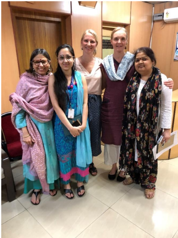
BFA:s handläggare på besök hos CARA.

ärenden eller har förmedlat många adoptioner ifrån. Besöken på de olika SAA var mycket meningsfulla eftersom BFA tidigare inte samarbetat med dem.