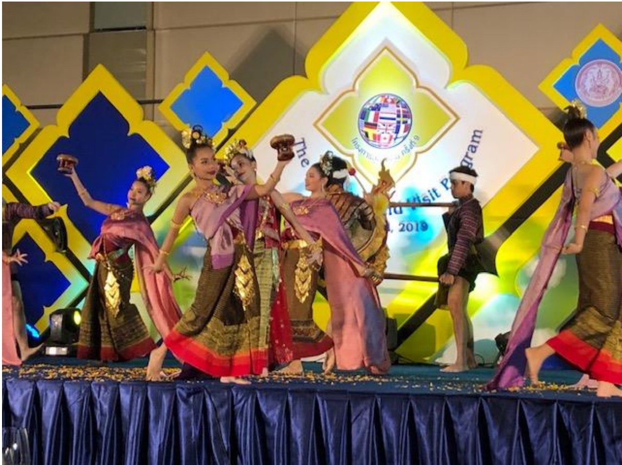
Invigning Native land visit program

5-14 juli anordnade DCY sitt nionde Nativeland visit program. Detta är ett program som hålls ungefär vart fjärde år där barn som adopterats från Thailand bjuds in tillsammans med sina familjer för att lära sig mer om thailändsk kultur och återknyta kontakten med sitt barnhem. DCY fyllde också 40 år under 2019 vilket gjorde programmet lite extra festligt. Handläggare från BFA deltog på den delen av programmet som var förlagd till Bangkok. Det hölls bl a en organisationsdag där vi fick en fördjupning kring DCY:s arbete och kunde utbyta erfarenheter med andra organisationer som var representerade. Det hölls också ett intressant seminarium om rotsökning.